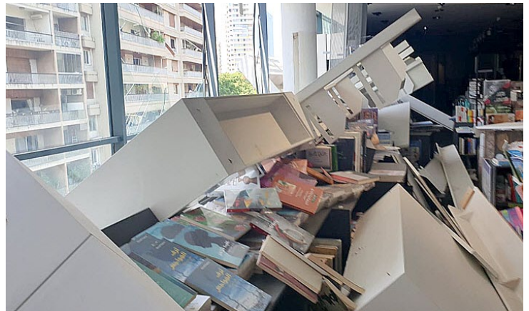
Daño a la Librería Antoine's ABC en un mall en Beirut después de la explosión del 4 de agosto.

* Con información de Publishing Perspectives