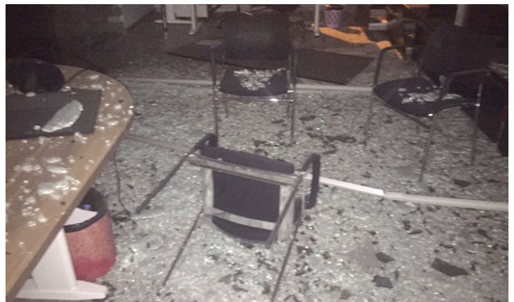
Daño que sufrió el AA Studio en Beirut.